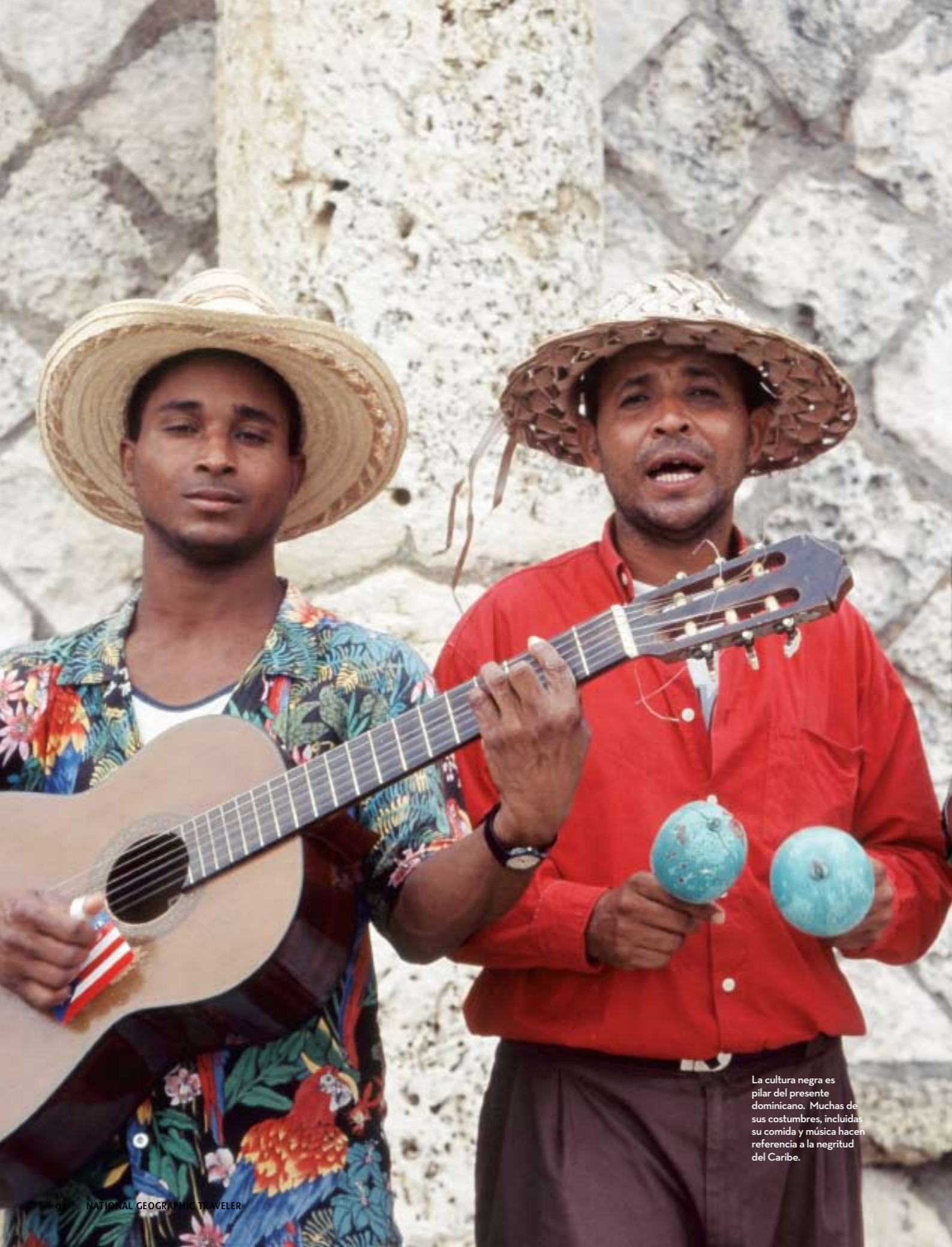
La cultura negra es pilar del presente dominicano. Muchas de sus costumbres, incluidas su comida y música hacen referencia a la negritud del Caribe.