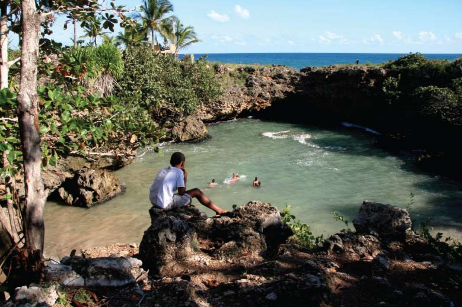
Nada como refrescarse en pequeñas piscinas naturales formadas a lo largo de la costa. Ahí, los lugareños se olvidan del calor y hacen una pausa a sus actividades cotidianas.

En el Parque Colón había un concierto de hip-hop para personas con discapacidades. El músico principal usaba muletas y el espectáculo de los bailarines en el escenario consistía en levantar la parte delantera de sus sillas de ruedas. Las colegialas los rodeaban practicando sus pasos de baile. La luz suave y delicada parecía posarse en la parte baja del cielo como en una puesta de sol perpetua, bañando la piedra y los edificios de colores pastel con un resplandor indulgente.