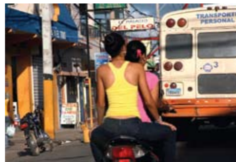
La mayoría de los jóvenes se transporta en motonetas, es la manera más fácil y rápida de recorrer su parte de la isla.

Me recogió en la terminal de autobuses y durante el recorrido pasamos los terrenos ajardinados de las urbanizaciones de lujo, algunas de ellas como ciudades estado en sí mismas. Tras unos cuantos kilómetros habíamos pasado plantaciones de palmeras y atravesado por pueblos pequeños donde las motos pululan por las calles. Había puestos de venta de pollo y tenderetes de lotería; carnicerías al aire libre con ristras de salchichas, escolares en pulcros uniformes café y azul y trabajadores en las partes