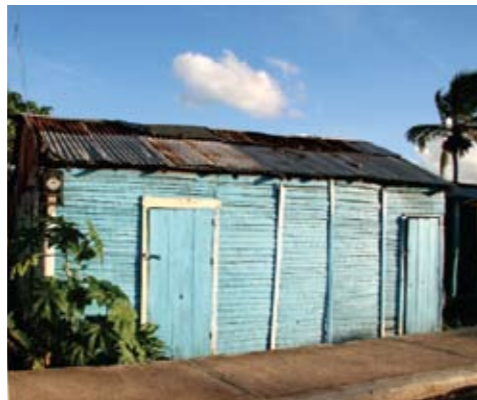
El carácter festivo de los dominicanos está presente en los colores que usan para sus viviendas sencillas.

Hay bares elegantes con camas de playa estilo balinés sobre la arena, discotecas con música techno atronadora y un bar irlandés—sólo en el Caribe un bar